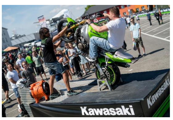
Am Wochenende drauf feiern Fans die Kawasaki Days.

Speyer. Honda, Toyota, Kawasaki und Co – der Juni im Technik Museum Speyer steht ganz im Zeichen der asiatischen Automobil- und Motorrad-Marken. Am 8. und 9. Juni 2024 kehrt das beliebte JACATU Treffen zurück auf den Museumsplatz. Am Wochenende darauf, 15. und 16. Juni 2024, werden die Fans der grünen Motorradfirma ganz auf ihre Kosten kommen. Die Kawasaki Days feiern das 40-jährige Jubiläum der Ninja-Baureihe. Beide Treffen sind für Besucher frei.